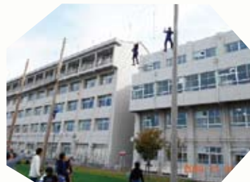
他の子どもが命綱を持ち、端から端まで渡ります。