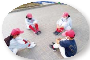
③ 待機中のソーシャルディスタンス確保 (おしゃべりしない)