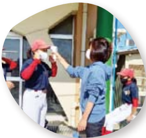
① まずは全身体温測定