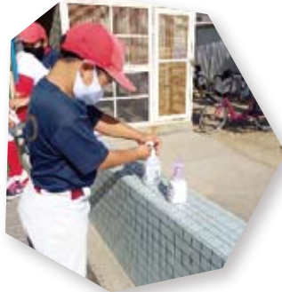
② 手指のアルコール消毒