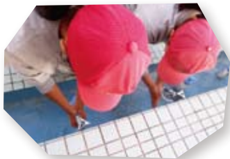
④ 練習の節目ごとに常に手洗い