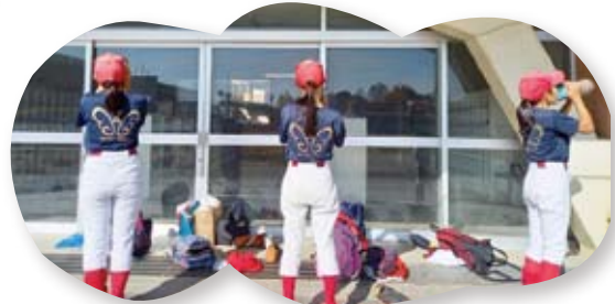
⑤ 練習中の水分補給もソーシャルディスタンス確保