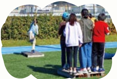
ターザンロープで向こうからやってくる子を、みんなで受け止めます。

関西大学堺キャンパスで行う仲間意識づくりを目的とした体験学習です。写真は去年の三島ブロックこども会での写真ですが、今年も工夫しながら開催しました！