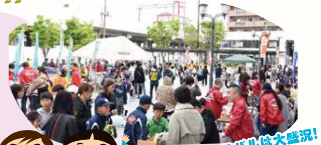
カーニバルは大盛況!

年に1回こども会カーニバルを高石駅前広場で開催。(令和2・3年度はコロナで中止)市内の協力団体とあてや輪投げ、わたがし・ポップコーンなどを出だし、多数の参加者で盛り上がりします。その他、工場見学や1泊キャンプ、オセロ大会、アイススケート大会なども行っています。