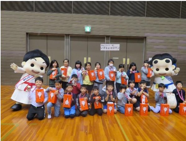
低学年 優勝 いず Bee ロマン