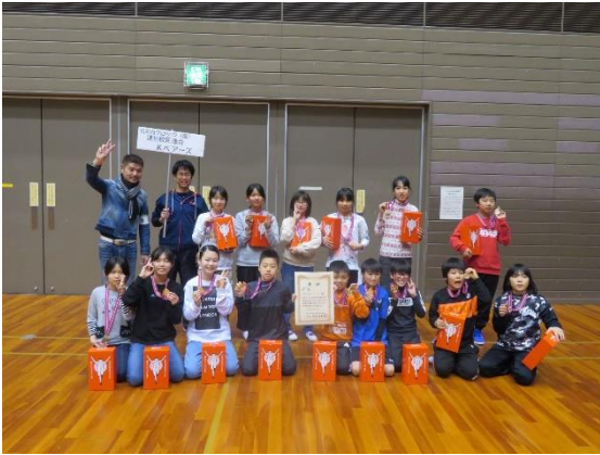
高学年 優勝 速見校区連合・K ベアーズ