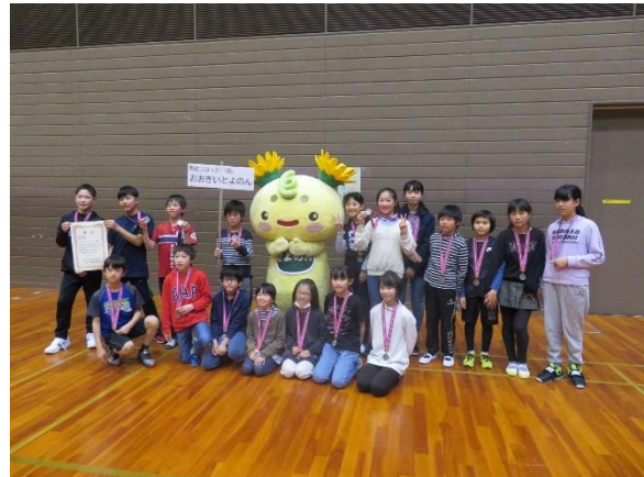
高学年 準優勝 おおきいとよのん