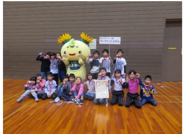
低学年 準優勝 ちいさいとよのん