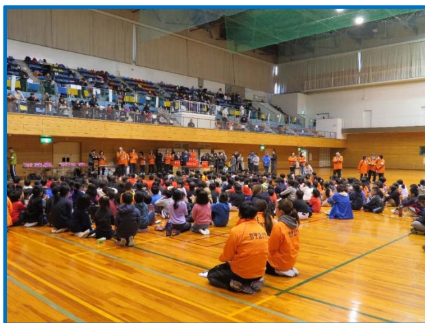
低学年優勝チーム泉北ブロック（いず bee ロマン）