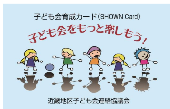
近畿地区共通「子ども会育成カード」

2022年度近畿地区子ども会大会にご参加の子ども会代表者の方は必ず「子ども会育成カード (SHOWN Card)」をご持参ください！引率のお子様にお楽しみプレゼントがあります。(先着 100名様)